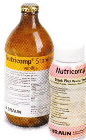
Medis, d.o.o. Brničeva 1, Ljubljana