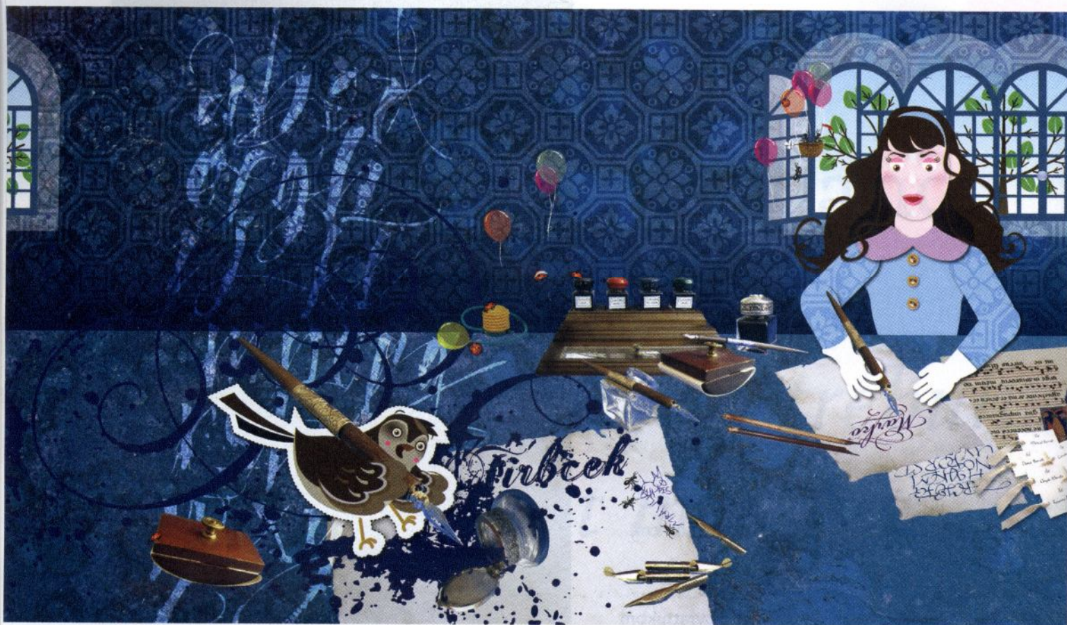
PISARKA, ilustracija za revijo Zmajček

Ste kot stomistka imeli kdaj težave z vključevanjem v družabno, vsakodnevno življenje?